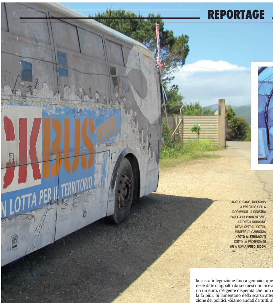
CAMPOPISANO, ROCKBUS A PRESIDIO DELLA ROCKWOOL. A SINISTRA L'ALCOA DI PORTOVESME. A DESTRA RIUNIONE DEGLI OPERAI. SOTTO, MINIERE DI CARBONIA SOTTO LA PROTESTA DI IERI A ROMA